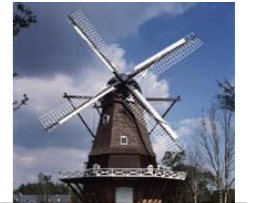
アンデルセン公園

行程 有明棧橋出発 ~ 船橋市浜町棧橋着 ~ 船橋市地方卸売市場 (昼食) ~ JAいちかわ船橋梨選果場 ~ ふなばしアンデルセン公園 ~ JR 船橋駅 (解散) 料金 大人2,400円、中学生1,200円、小学生700円、小学生未満は無料 (定員40名) ※昼食なし ※乗船のみは大人1,000円、小学生500円、小学生未満は無料