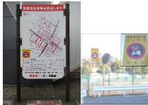
図 船橋市における放置自転車対策の実施 (自転車等放置禁止区域の啓発等)