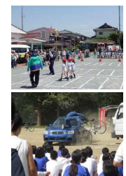
図 船橋市における交通安全教室