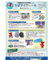
図 自転車の安全利用ルールを10項目にまとめた「ちばサイクルール」（千葉県）