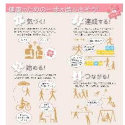
図 +10（プラステン）の概要