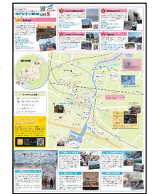
図 シェアサイクルで回遊できる市内のロケ情報が満載の「ふなロケマップ」