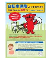
図 自転車保険啓発チラシ（千葉県）