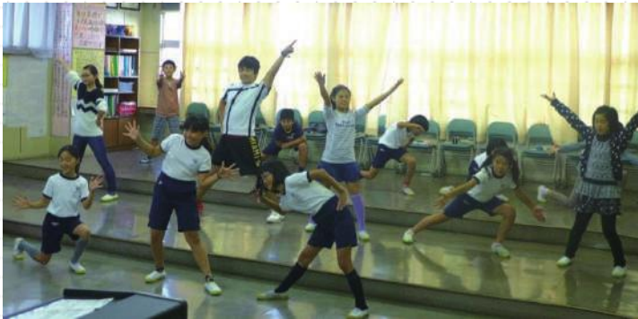
ダンスクラブで行う文化活動普及事業の風景 (高郷小学校) (平成 28 年度)