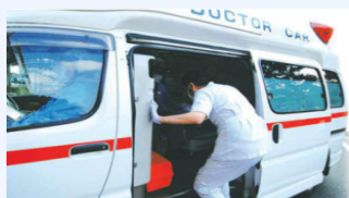
ドクターカーシステム