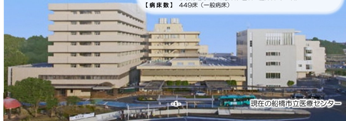
現在の船橋市立医療センター