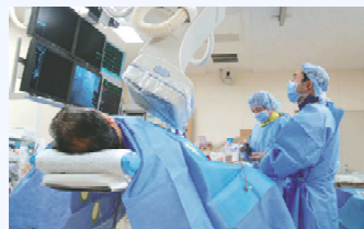
心筋梗塞に対する冠動脈カテーテル治療