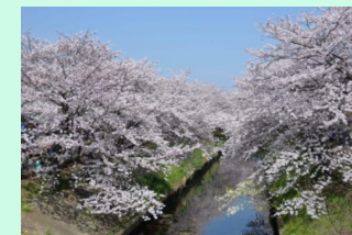
新しいまちづくりを彩る海老川の桜