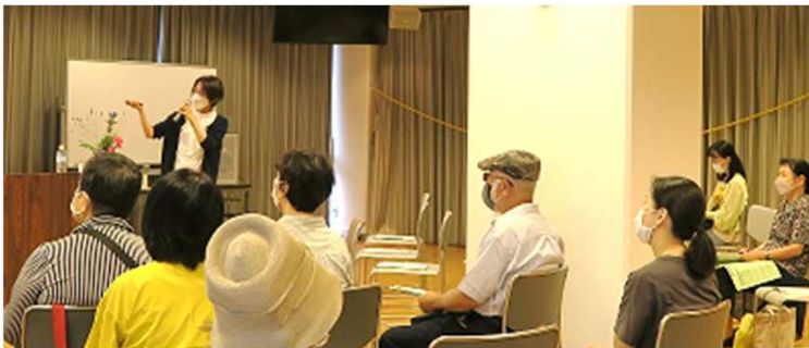
フェスティバルの様子(運営委員会企画講座)

コロナ禍を超えて次世代へつなごう！をテーマに11団体が参加し、講座10企画、展示5企画が催されました。参加された方からは「参加して“たくさんの学びと出会いあり”参加して良かった」