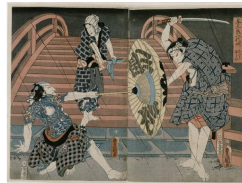
「こうもり安を切る」(国貞)