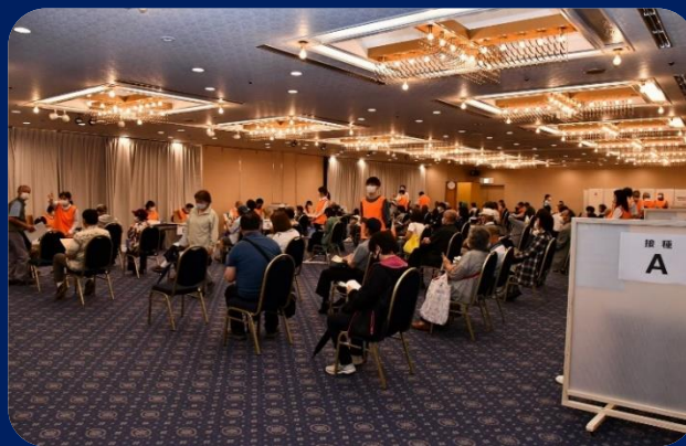
旧船橋グランドホテル