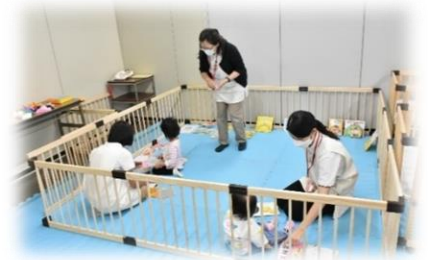
市役所 キッズスペース