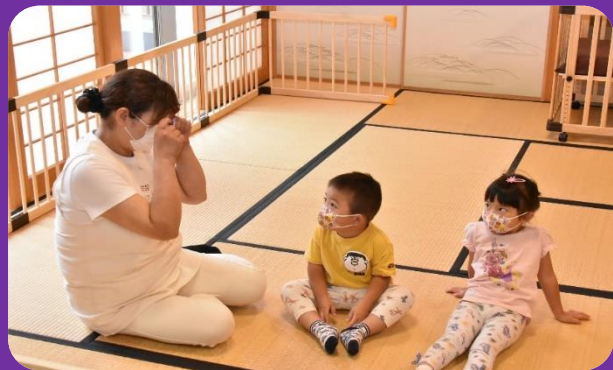
北部公民館キッズスペース