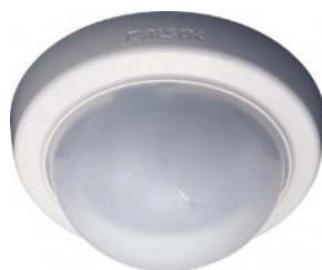
ライフリズムセンサー1台