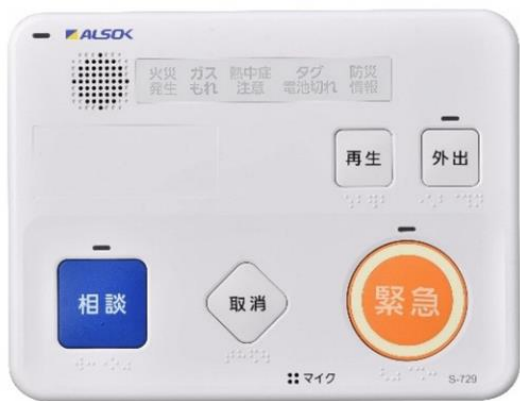
コントローラー1台