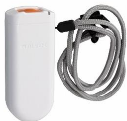
救急ペンダント1台

センサーが24時間反応しなかった場合には、自動的にALSOKへ通報が入り、警備員が駆け付けを行います。