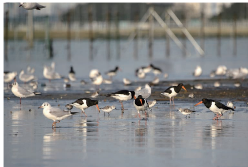
三番瀬に集う野鳥