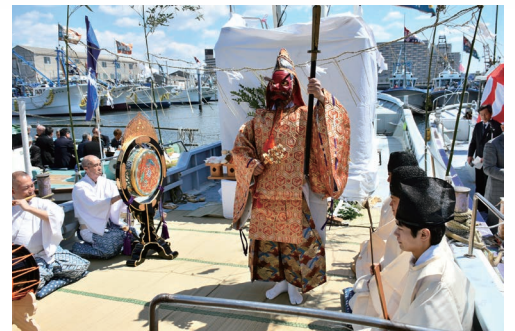
江戸時代から続いている「水神祭」