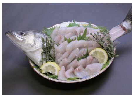
江戸前の高級魚スズキ