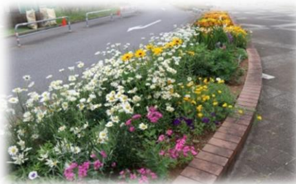
団地内にある花壇