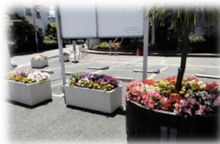
自治会内にある花壇

※対象経費の購入（花苗等）は、 交付決定の通知後 となりますので、購入にあたっては日付に注意してください。