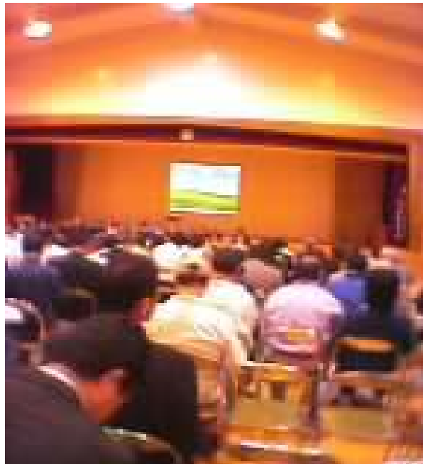
写真 説明会の様子