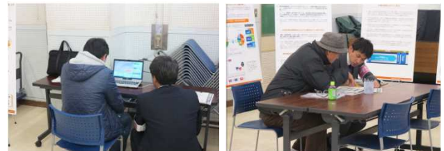
市民相談会（松戸市会場）の様子