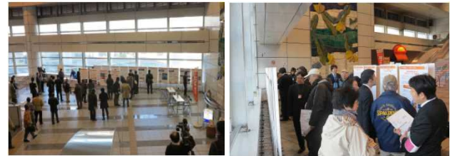
市民相談会（千葉市会場）の様子

また、各地域の皆様のご関心に応じた形で、パネルや映像資料などを用いた情報提供が行われました。