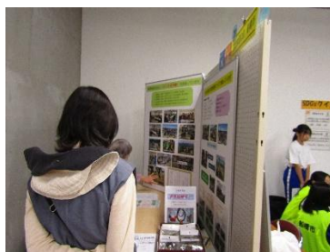
パネル展示のイメージ