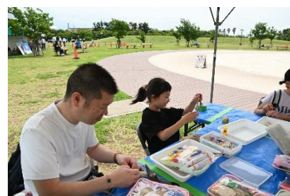
工作・体験コーナーのイメージ