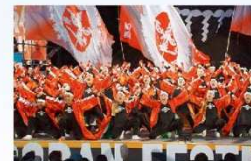
REDA舞神楽のよさこい講習会