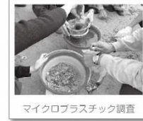
マイクロプラスチック調査