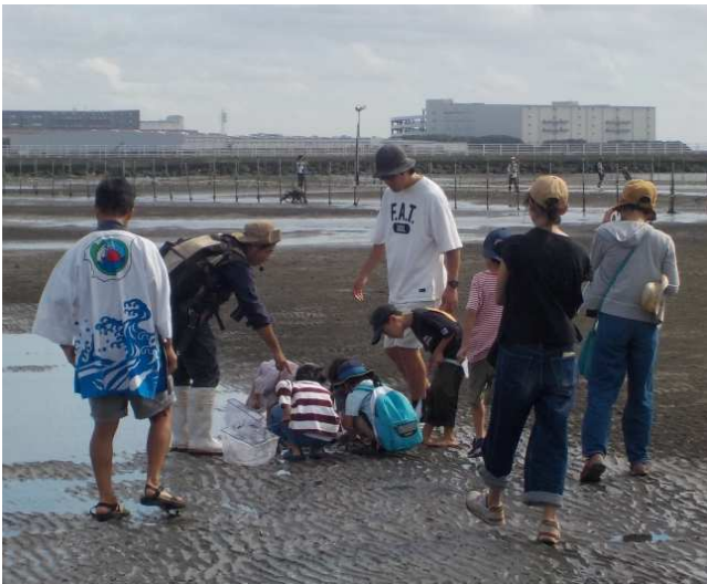
●干潟の生き物観察の様子