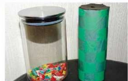
海洋プラスチックごみを使った万華鏡づくり