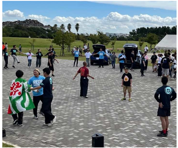
●よさこい講習会の様子