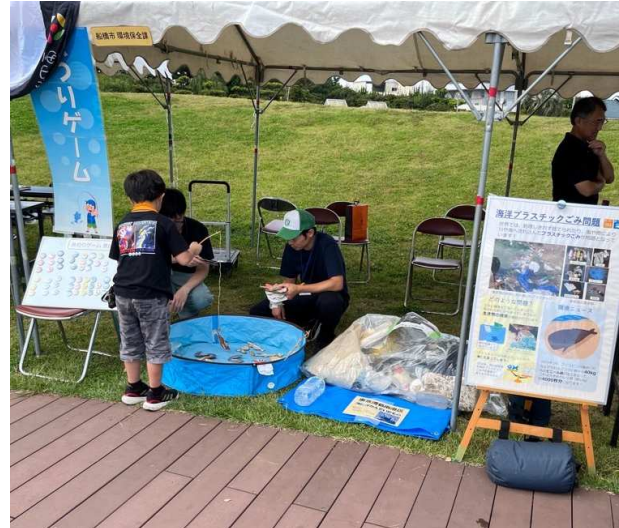
●海洋プラスチックごみ問題 について知ろうの様子