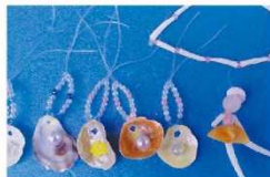
三番瀬に漂着する流木や貝がらを利用した工作体験