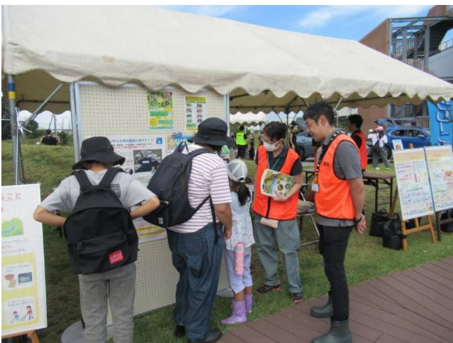
●パネル展示の様子