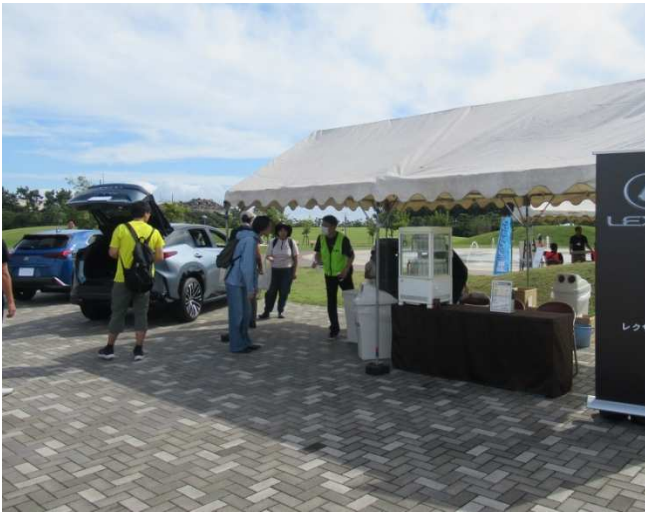
●BEV車による給電イベントの様子