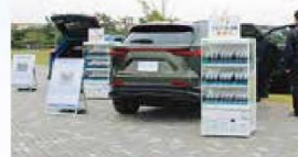
EV車による給電イベント