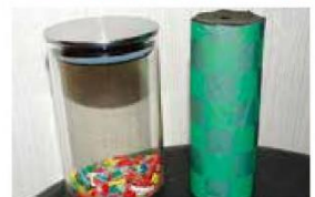
マイクロプラスチックを使った万華鏡作り

協賛 京葉ガス株式会社、一般社団法人京葉食品コンビナート協議会、合同製鐵株式会社 船橋製造所、東京納品代行株式会社、ネットヨタ千葉株式会社 レクサス船橋、株式会社ハイパーサイクルシステムズ、フジッコ株式会社 東京工場、船橋港業株式会社、公益社団法人船橋市清美公社、船橋市有価物回収協同組合（50音順）