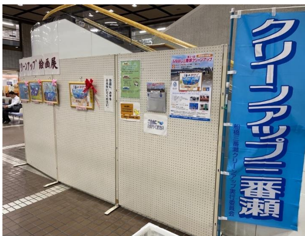
●ポスター用絵画作品展 (市役所1階ロビー)