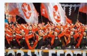
REDA 舞神楽のよさこい講習会