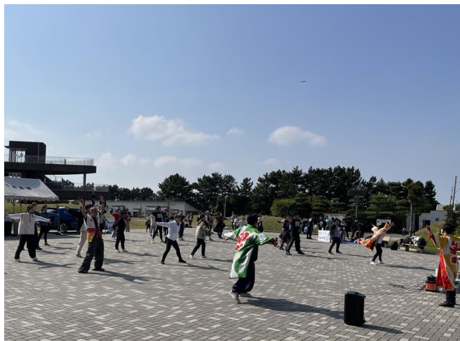
●EV車の給電イベント及び よさこい講習会の様子