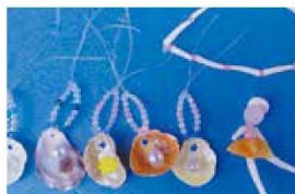
三番瀬に漂着した流木や貝殻で工作体験