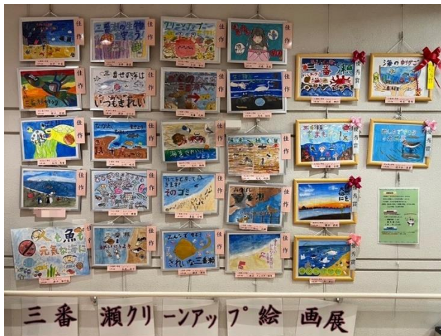
●ポスター用絵画作品展 (高根台公民館)