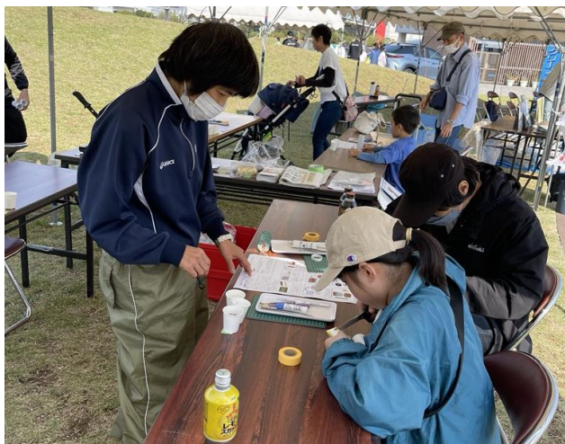
●マイクロプラスチックを使った 万華鏡作りの様子