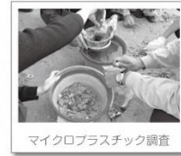
マイクロプラスチック調査