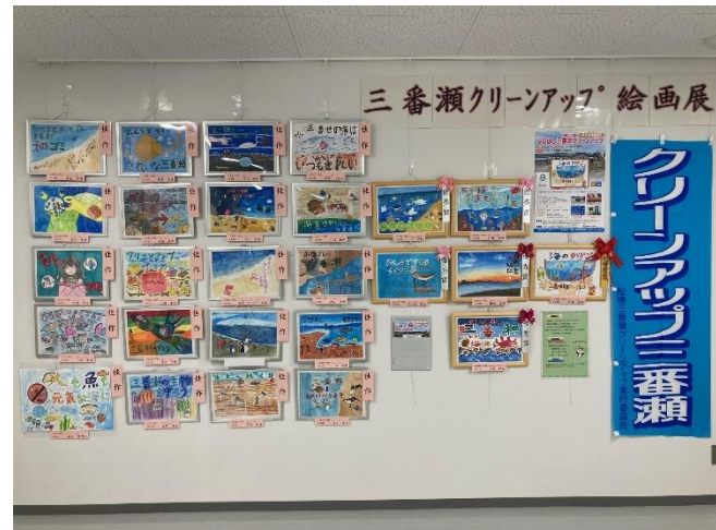
●ポスター用絵画作品展(ふなばし三番瀬 環境学習館2階生物多様性情報室)