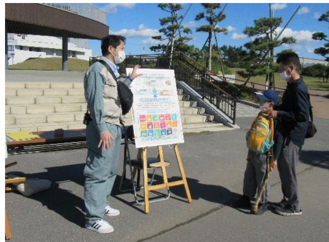
●生物多様性、船橋市環境基本計画、 SDGsのパネル展示の様子