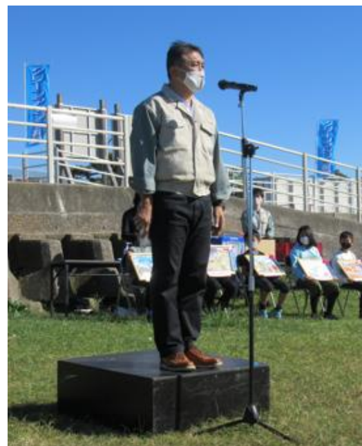
御園生環境部長 挨拶