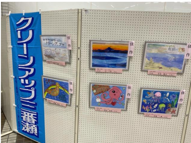
●ポスター用絵画作品展 (市役所1階ロビー)