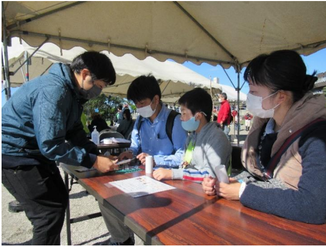
●マイクロプラスチックを使った 万華鏡作りの様子