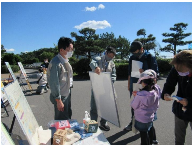
●地球温暖化対策のパネル展示の様子