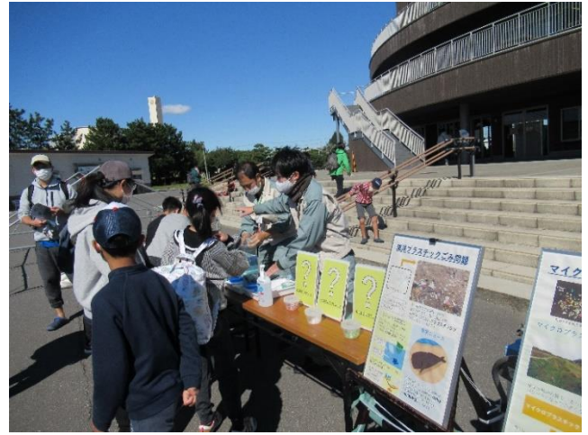
●プラスチックごみについて知ろうの様子