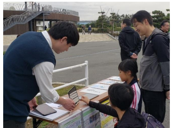
協議会員によるアプリを使用したエコ診断