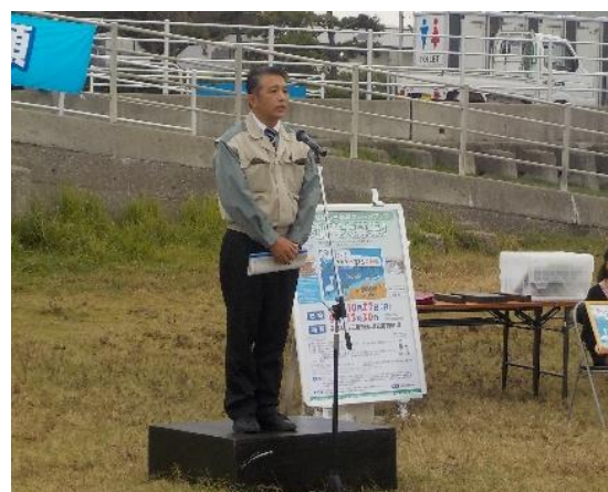
御園生環境部長 挨拶