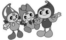
図 クリーン推進課 まち美化・指導係 ☎ 436-2434

清掃活動は、誰もが気軽に参加できるボランティア活動です。船橋市では、年2回、市内一斉清掃事業を行っていますが、参加したことがありますか? ぜひみんなで参加しましょう!