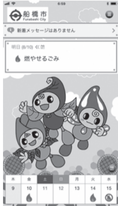
▲「さんあ〜る」トップページ