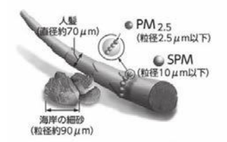
浮遊粒子状物質の大きさ比較

市内の大気環境情報はホームページにて最新データを公開していますのでご覧ください。 URL: http://www.funabashi-kantele.jp/taiki/