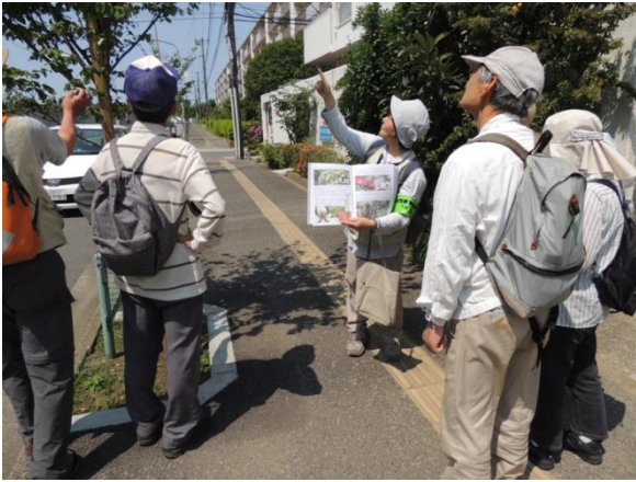
スタート地点近くにあるヤマボウシの街路樹を 観察。