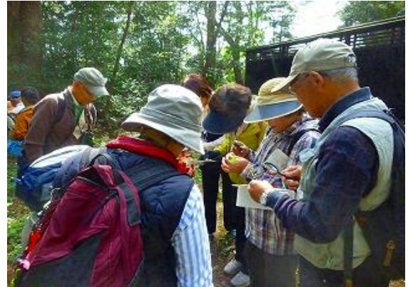
八王子神社にてひっつき虫の観察。