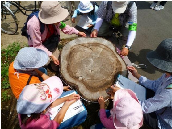
皆で杉の木の年輪を観察。