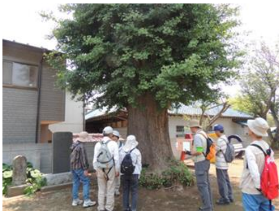
観行院にてイチョウの巨木観察。