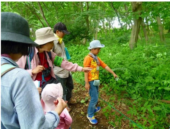
藤原市民の森を散策。たくさんの生き物を観察。