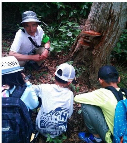
大きなキノコを発見。名前の由来を学ぶ。