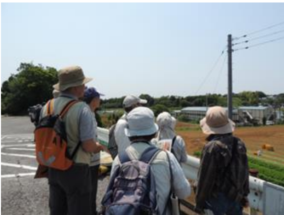
谷津地形の成り立ちについての説明。