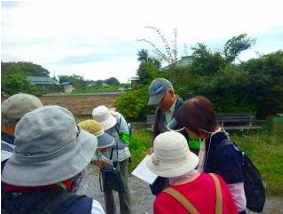
古和釜十字路公園にて地名の由来などを学ぶ。