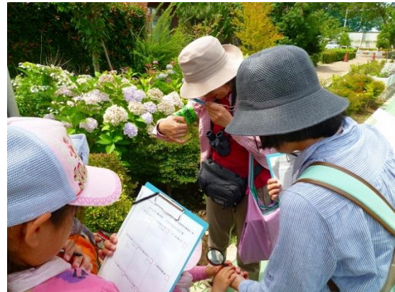
動植物のピンゴカードを使って特徴を観察。