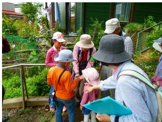
虫眼鏡を使って幼虫を観察。