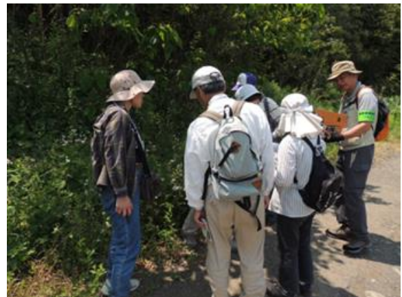
高根川付近にて荒地でも真っ先に芽を 出すパイオニア植物を観察。