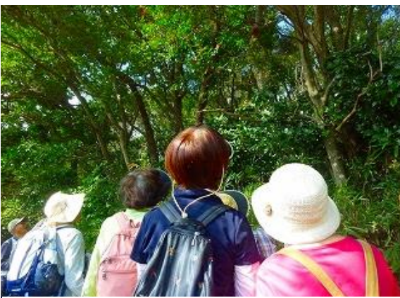
大穴南にてゴンズイの観察。