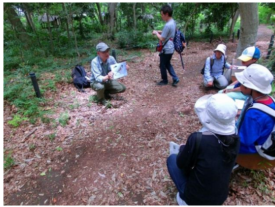
丸山の森緑地で鳥類の特徴を学ぶ。