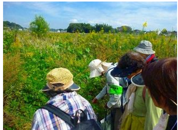
木戸川沿いにてツルマメなどの植物を観察。