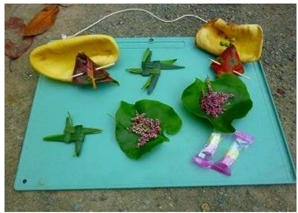
子供班では草木工作。