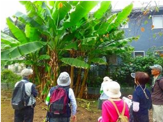
東光寺にてバショウの観察。