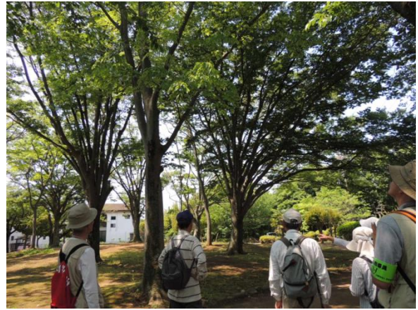
公園にあるケヤキの木を観察。