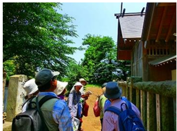
高根神明社にてスダジイの観察。