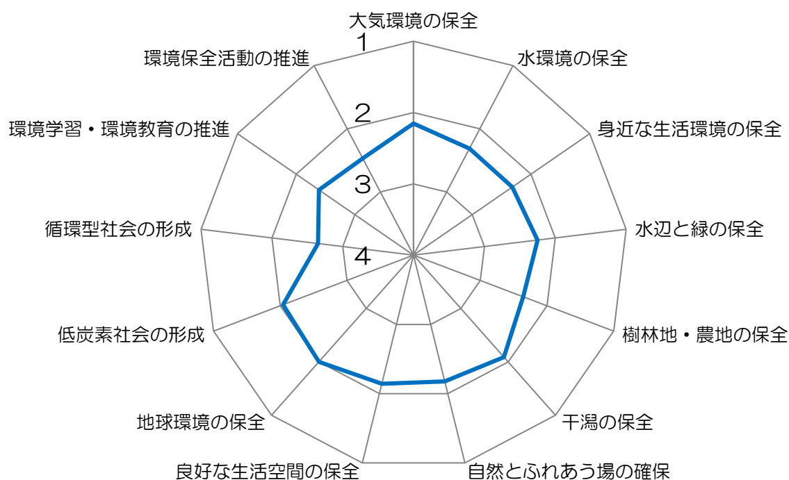
図 2 基本施策ごとの評価値の平均

施策分野ごとの評価値の平均（図 3）をみると、各分野の比較による特定の分野における遅れはみられませんが、令和元年度と比較して各分野の評価値が低下していることから、全体的に施策を推し進める必要があります。