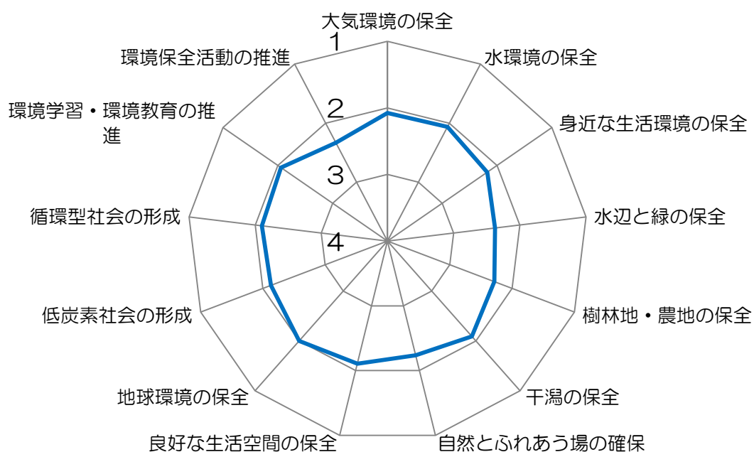
図 2 基本施策ごとの評価値の平均

施策分野ごとの評価値の平均（図 3）をみると、「生物多様性の確保」については他の項目と比較して遅れがみられました。