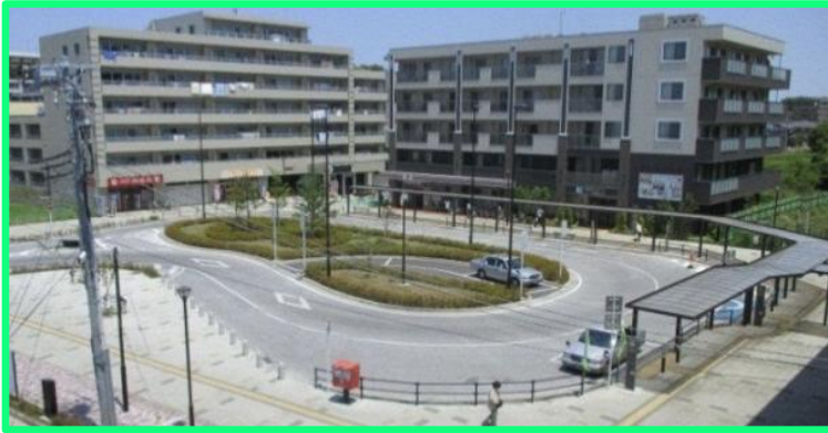
■飯山満駅前交通広場(平成25年4月竣工)

発注機関：船橋市公園緑地課 (仮称)飯山満土地区画整理地内1号公園整備工事 完成見込み：令和8年9月予定 主な工事：公園整備工