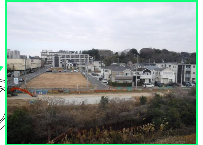
■飯山満駅北側(49街区周辺)