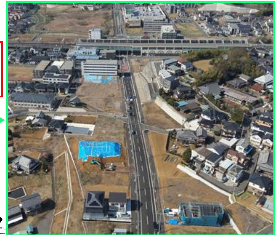
■都市計画道路3・4・27号線(19街区周辺)