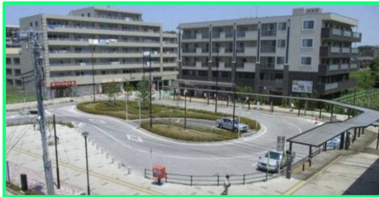
■飯山満駅前交通広場(平成25年4月竣工)

令和4年 千葉県事業 発注機関:葛南土木事務所 完成見込み:~来年3月予定 主な工事:樋管工事