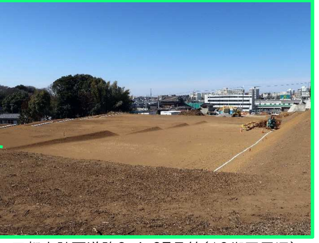
■都市計画道路3・4・27号線(19街区周辺)