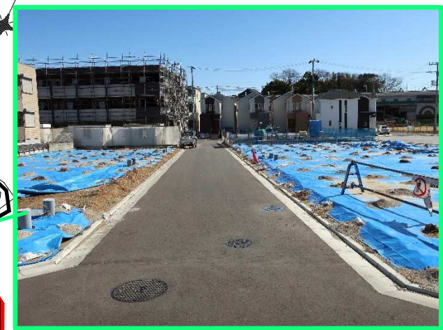
■58街区付近(道路整備等完了)

54街区整備工事 施工業者:カネケン京葉コミュニティ(株) 完成見込み:~本年11月予定 主な工事:道路築造、宅地造成 上下水道管布設