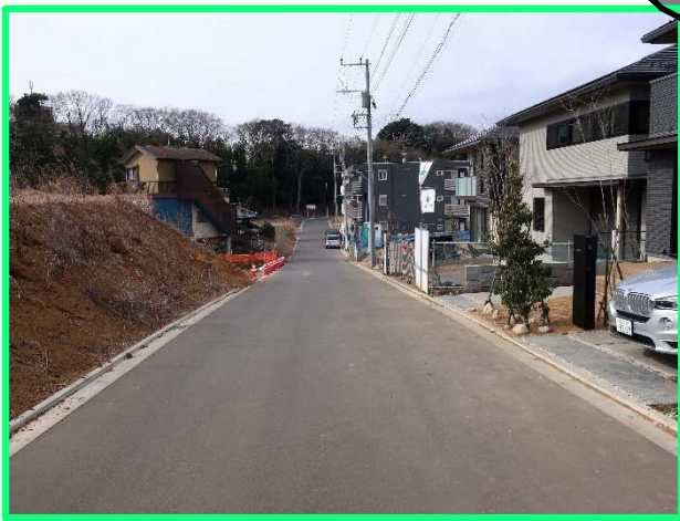
■12街区付近(道路整備等完了)

令和4年 千葉県事業 発注機関:葛南土木事務所 完成見込み:~来年3月予定 主な工事:樋管工事