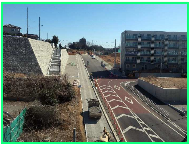
■飯山満駅南側(都市計画道路3・4・27号線沿道)