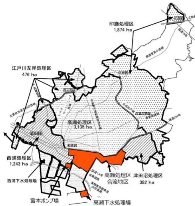
図 1-1 本事業の対象施設

管路施設は、他の地区にまたがる幹線も存在する。責任範囲を明確化する為、高瀬処理区合流地区のうち、本事業の対象となる範囲を図 1-2 に示す。