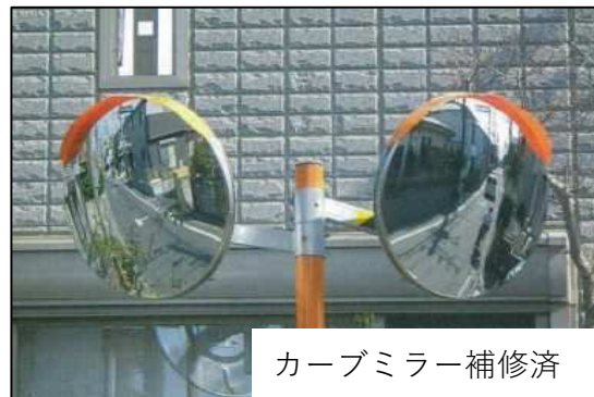
カーブミラー補修済