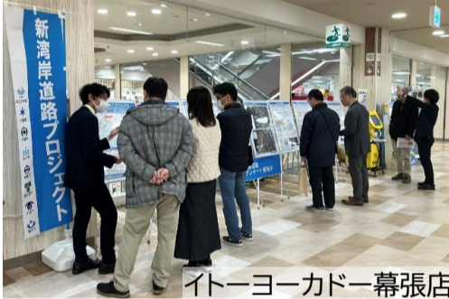
イトーヨーカドー幕張店