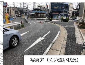
写真ア (くい違い状況)