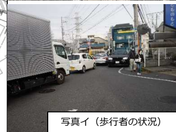
写真イ (歩行者の状況)