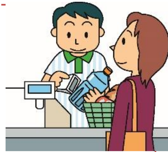
「消費者庁イラスト集」より