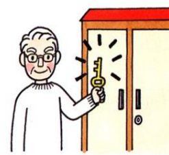
物置・車庫には鍵を