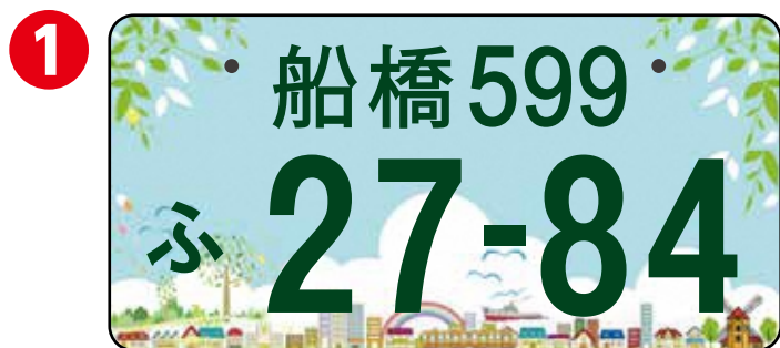
千葉県の中核都市

この5作品の中で、市民投票で1位になったものを自動車向け「船橋ナンバー」のデザインに決定します。多くの市民の皆様のご投票をお待ちしております。