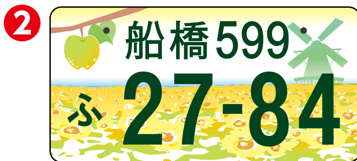
梨とアンデルセン公園