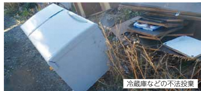
冷蔵庫などの不法投棄