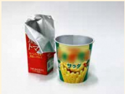
アルミコーティング紙