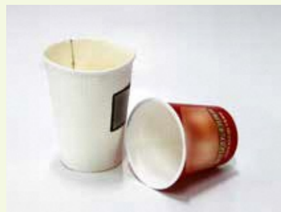
防水加工紙 (紙容器など)