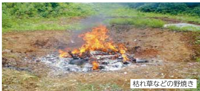
枯れ草などの野焼き

不法投棄や野焼きは法律で禁止されており、罰則として5年以下の懲役若しくは1,000万円以下の罰金(法人は3億円以下)が定められています。船橋市では廃棄物の適正な処理を推進するため、土日夜間を含め、パトロールなどの監視活動に取り組んでいます。