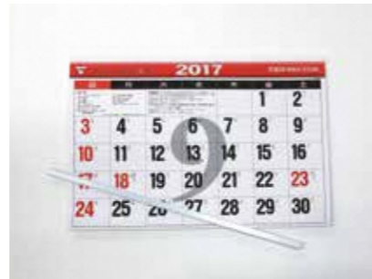
カレンダー (金具などは除く)