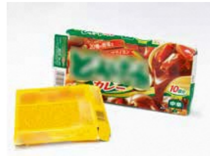
お菓子や食品の箱 (つぶす)