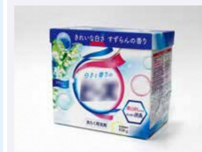
洗剤や線香の箱など

× 汚れや臭いのついたもの(処理工程で臭いや汚れを除けず衛生上などの問題があります)