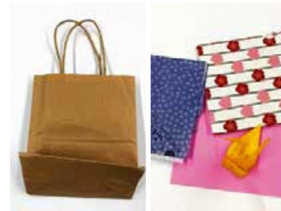
紙袋 包装紙や折り紙