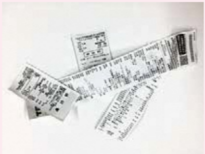
感熱紙 (レシートなど)