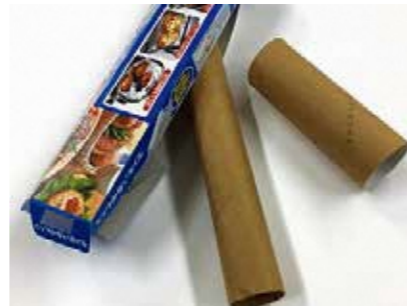
ラップ・トイレトペーパーなどの芯