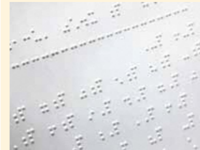
感熱性発泡紙 (点字印刷など)

× 特殊加工されたもの(混入すると、再生紙に凹凸が出たり、印刷不良を起こします)