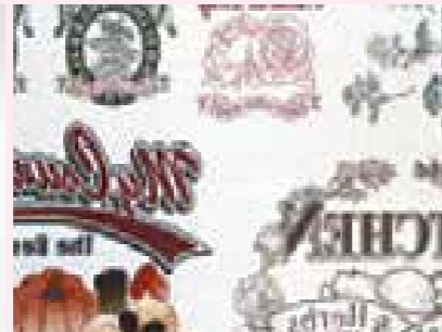
昇華転写紙 (アイロンプリントなど)