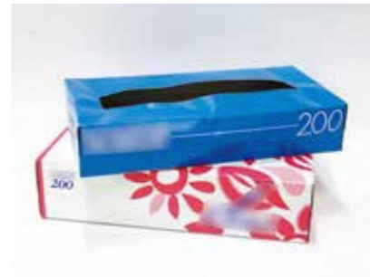
ティッシュ箱 (ビニール除く)