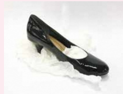
靴や靴などの詰物 (捺染紙)