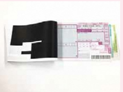
カーボン紙 (伝票など)

× 特殊加工されたもの(混入すると、再生紙に凹凸が出たり、印刷不良を起こします)