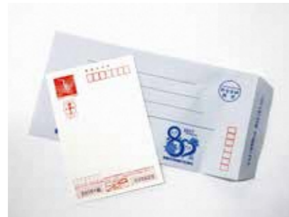
封筒・はがき (氏名、住所黒塗り)