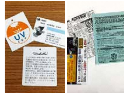
タグや名刺 チラシや印刷物