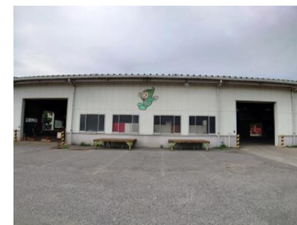
船橋ビン・カン・ペトリサイクルセンター

作業員のチェックを受けたリサイクル可能なペットボトルは減容機で圧縮・梱包し、ベールと呼ばれる1m四方の塊にします。