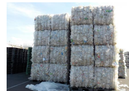
積み上げられたベール