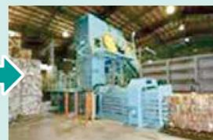
③古紙の種類ごとに、こん包します。