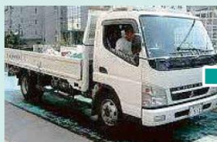
①集団回収で集められた古紙は、古紙問屋へ運ばれます。