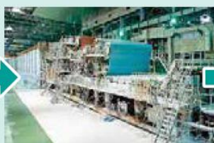
⑥紙繊維を乾燥させます。