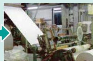
⑦ロール状にしたり、一定の大きさに裁断し製品となります。