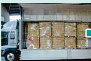
④こん包した古紙を製紙工場に出荷します。