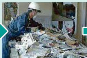
②古紙の種類別に製紙原料にならないものや、製品不良の原因になる異物を取り除きます。