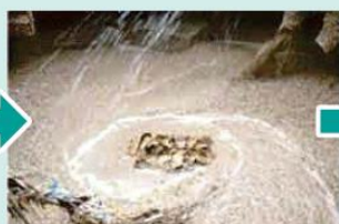
⑤古紙をほぐして、繊維に戻す装置に入れます。