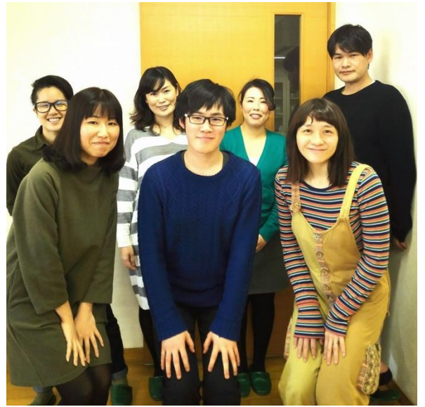
JASH メンバーの皆さん