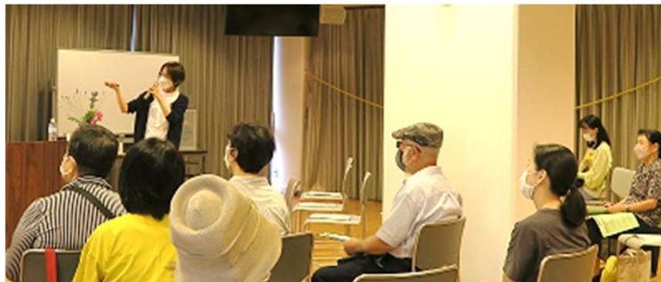
フェスティバルの様子(運営委員会企画講座)

参加された方からは「参加して“たくさんの学びと出会いあり”参加して良かった」、「次回開催したら是非参加したい」などの感想が寄せられました。