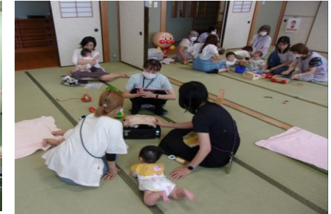
すこやか広場の様子