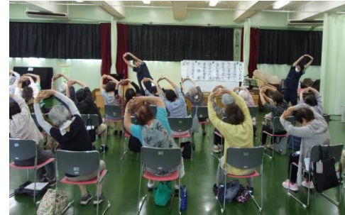
ミニデイサービスの様子