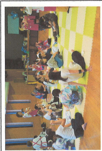
【参加親子とのふれあい】