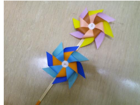
令和7年度クラフトタイムスペシャル 「二連風車」