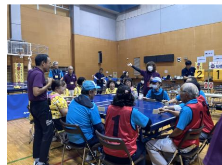
<予選ブロック大会>