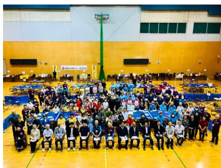
<中央大会の集合写真>