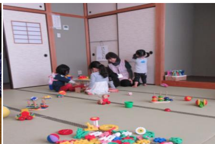
すこやか広場の様子