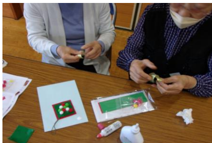
工作キットを使用しての工作