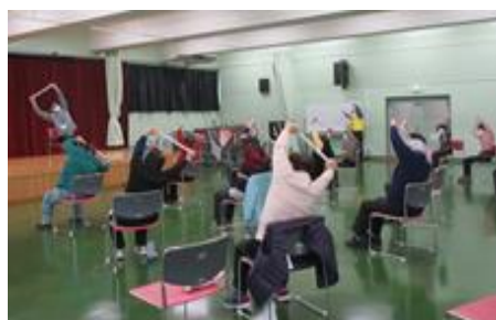
ミニデイサービスの様子