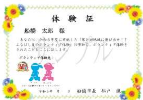
昨年度の体験証デザイン