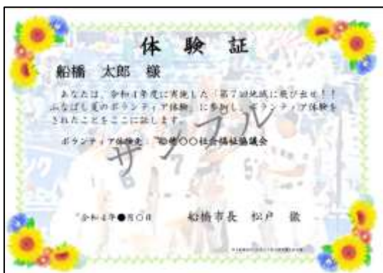
昨年度の体験証デザイン