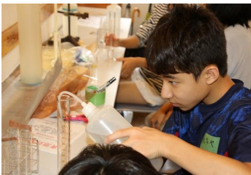
青潮対策科学実験