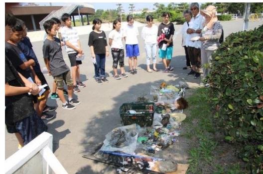
プラスチックごみ拾い後授業