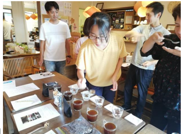
コーヒーイベント