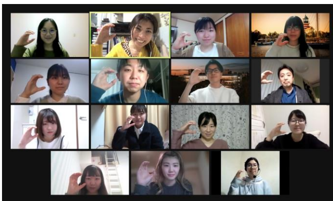
オンラインでの打ち合わせの様子