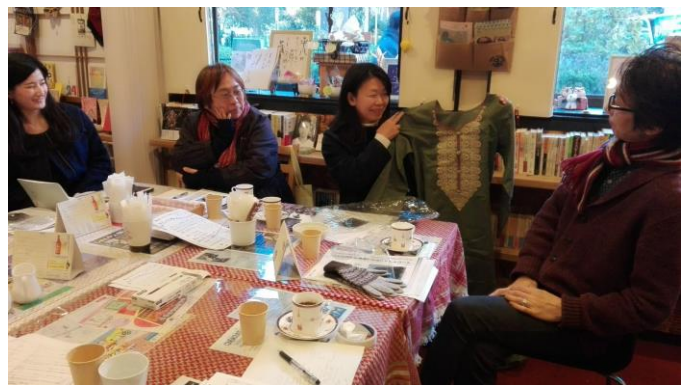
フェアトレード団体との座談会の様子