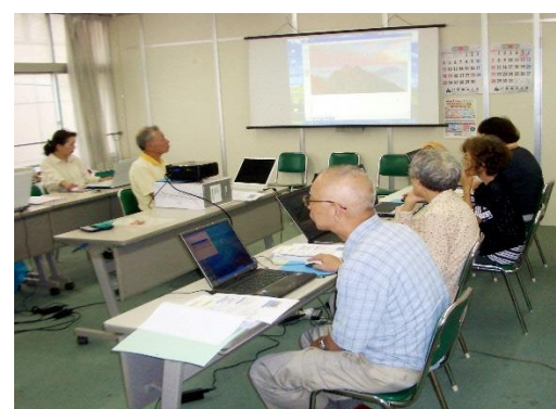
【船橋本町通パソコン講座】