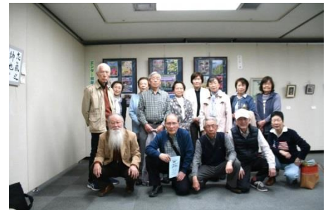
【パソコンによるデザイン画 見学会 当日松戸市長ご来場】