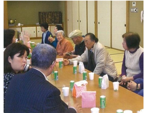
【旭市災害支援「楽しみの集い」での懇親会】