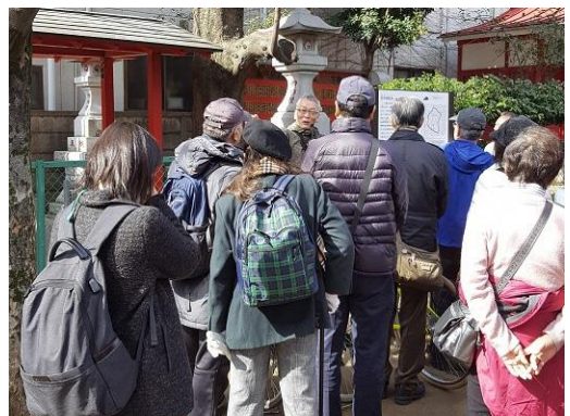
【「ディープな船橋を知ろう」で船橋の街歩きの様子】