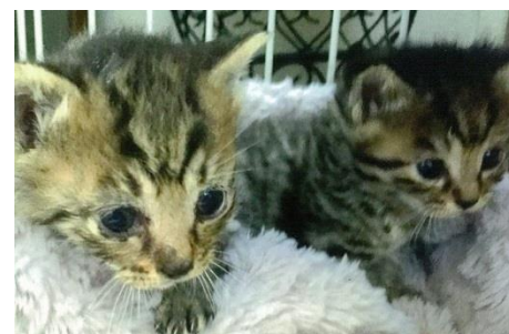
【キャット・トラストミーより新しい家族へ 初めての巣立ち ひな&みく】