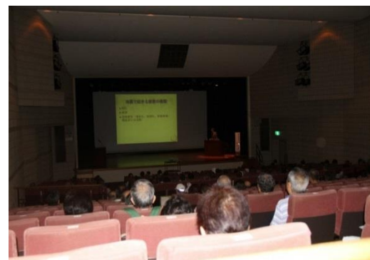
【勤労市民センターでの防災フォーラム】