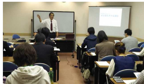
【NPO 向けの講座 「事業報告書作成のための会計講座」】