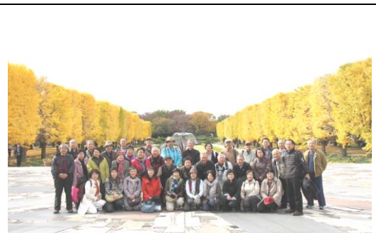
【分科会「ボラサロ歩こう会」活動 「健康と親睦のバス旅行」】