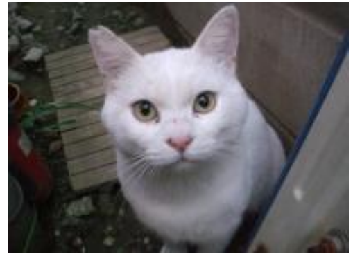
【野良猫トラブルゼロを目指して】