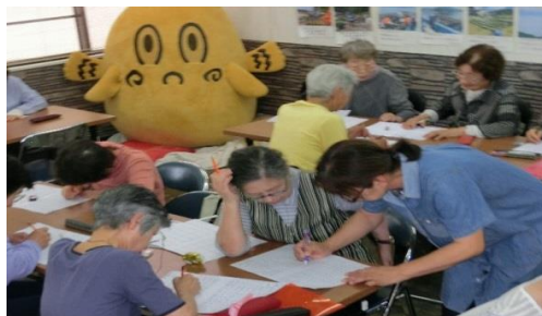
【ペン習字教室 千葉ふなふれあいサロン】