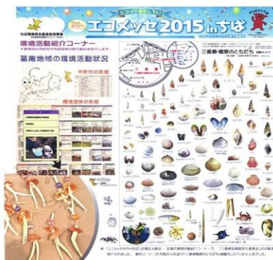
【エコメッセ2015 in ちば】